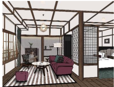
アルプス館 客室イメージ