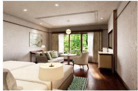
碓氷館 客室イメージ