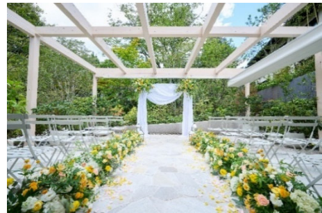
檜テラス イメージ