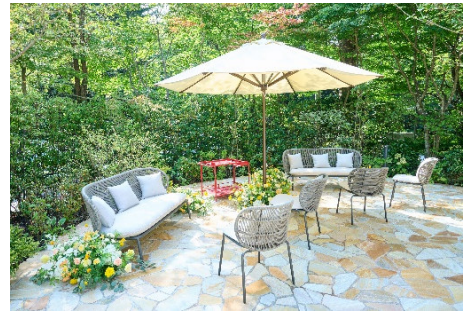
バンケットルーム専用テラス イメージ