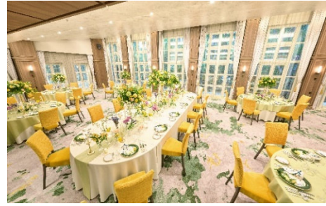
バンケットルーム「桜」イメージ